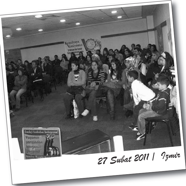
27 Subat 2011 | İzmir