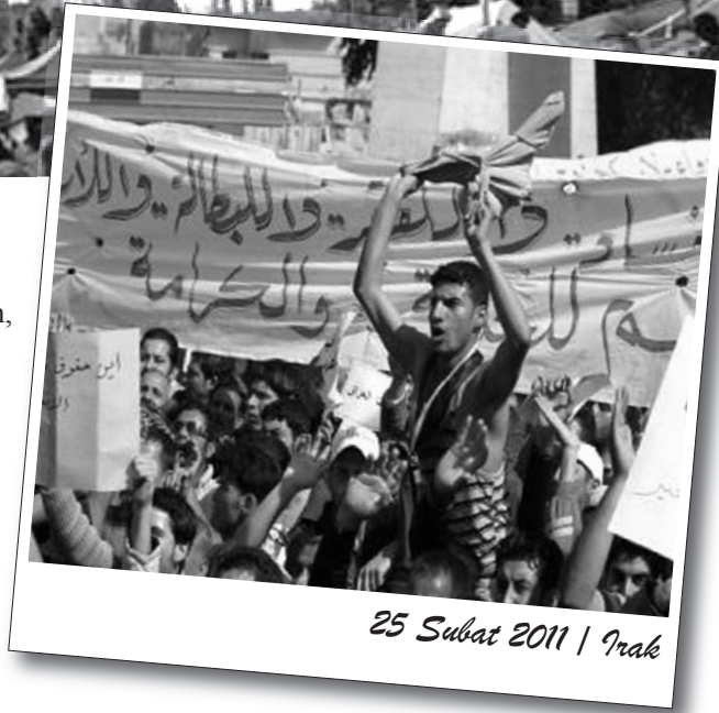
25 Şubat 2011 | Irak

Ülkenin güneyindeki Salallah kentinde de cuma gününden beri valilik binası yakınına kamp kuran